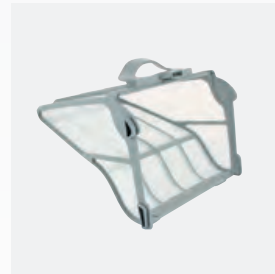
Filterkorb (60μ) Leicht zugänglich und mit großem Fassungsvermögen (5 Liter)